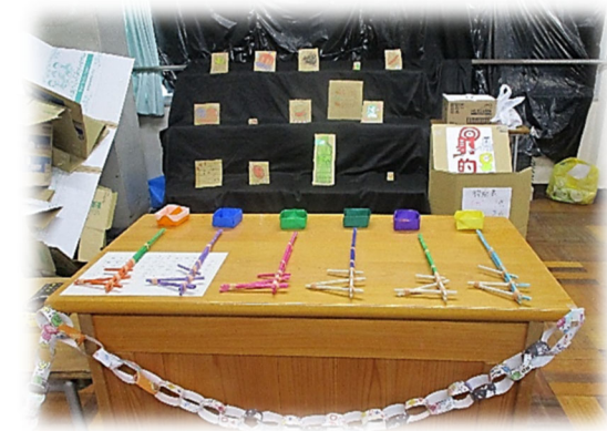
< クラス展示 >

さあ、長い夏休みが始まります。せっかくの長期の休みです。大きなことでなくても構いません。今しかできないことに是非取り組んでみましょう。各教科からの宿題もあります。計画的に取り組みましょう。そしてみんなで元気に2学期を迎えましょうね。